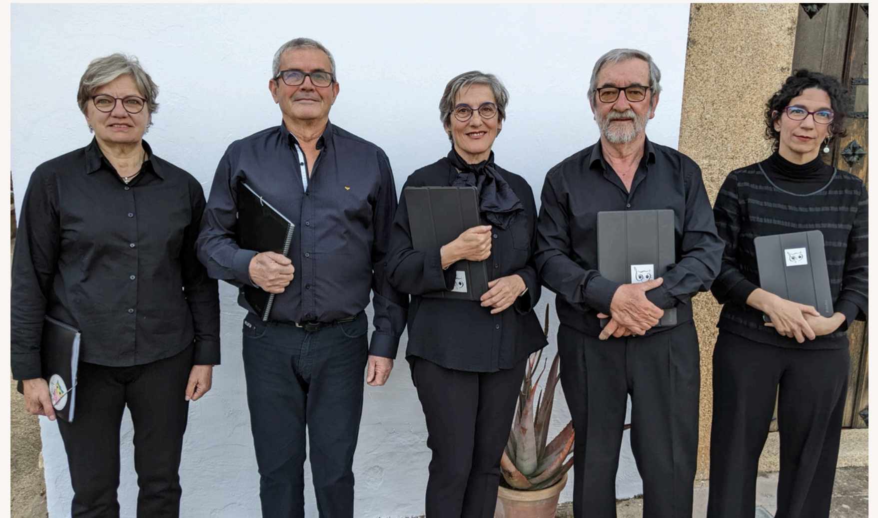
Grupo de cámara Búho

Los cinco componentes de este quinteto inicial cuentan con larga experiencia como coralistas y estudiosos musicales.