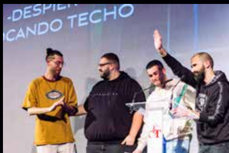
MEJOR CANCIÓN DE EXTREMADURA (PME 2024)