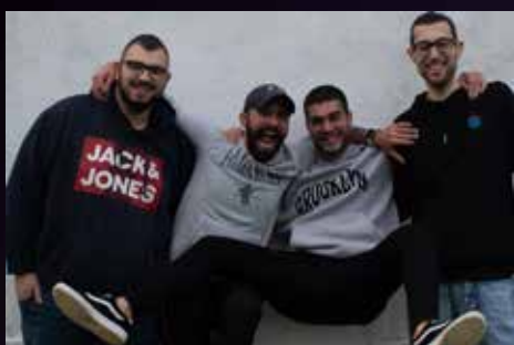
TOCANDO TECHO SE PONE A LA ALTURA DE LOS MÁS GRANDES (PERIÓDICO EXTREMADURA 2023)