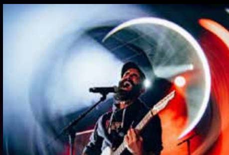
TOCANDO TECHO LLENA DE ROCK EL FESTIVAL (SEVILLA 2026)