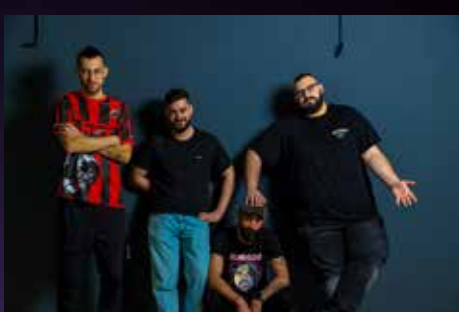
TOCANDO TECHO, ROCK SIN FILTROS (LACARNE MAGAZINE 2026)