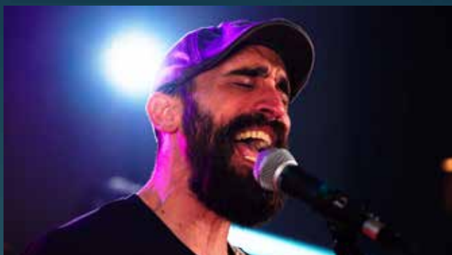
QUE LES DEN POR CULO (VIDEOCLIP OFICIAL)